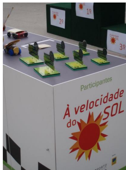
Figura 4 – Pódio e Troféus de edições anteriores

Todos os participantes terão um diploma de participação no Projeto.