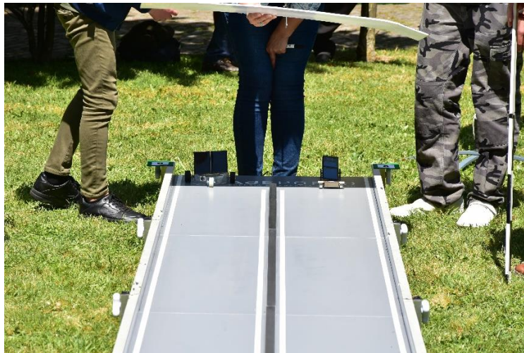
Figura 3 – Corrida entre dois carrinhos participantes em edições anteriores

A(s) corrida(s) realizar-se-ão no âmbito da SEA em data e local a anunciar.